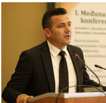
Ministar, Vjekoslav Čamber