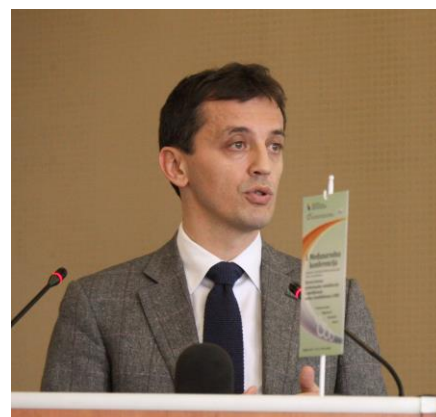
Ministar, Predrag Bošković