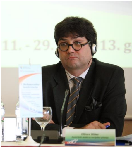
Austrijski ataše za socijalna pitanja, Oliver Hiler