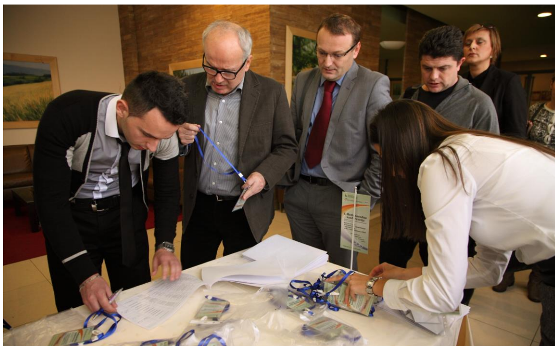
Na konferenciji prisustvovalo 120 učesnika

Na konferenciji su aktivno učestvovali između ostalih federalni ministar rada i socijalne politike Vjekoslav Čamber, direktor Fonda Ivica Marinović, direktori i predstavnici zavoda/službi za zapošljavanje, predstavnici resornih ministarstva, PIO/MIO, Zavod za zdravstveno osiguranje, direktori firmi, direktori službi socijalne zaštite, predstavnici organizacija osoba s invaliditetom te ostali ključni subjekti iz oblasti profesionalne rehabilitacije i zapošljavanja osoba s invaliditetom.